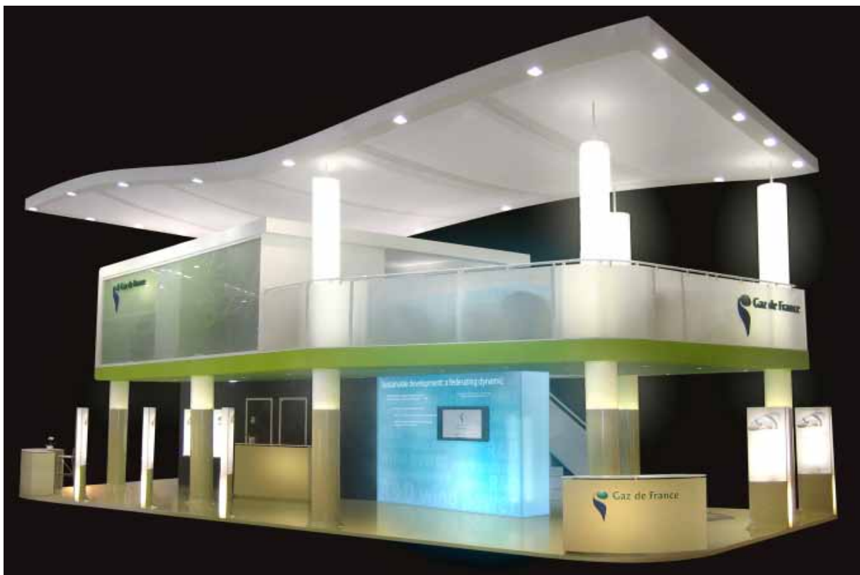
World Energy Congress Rome 100 m 2 sur 2 niveaux