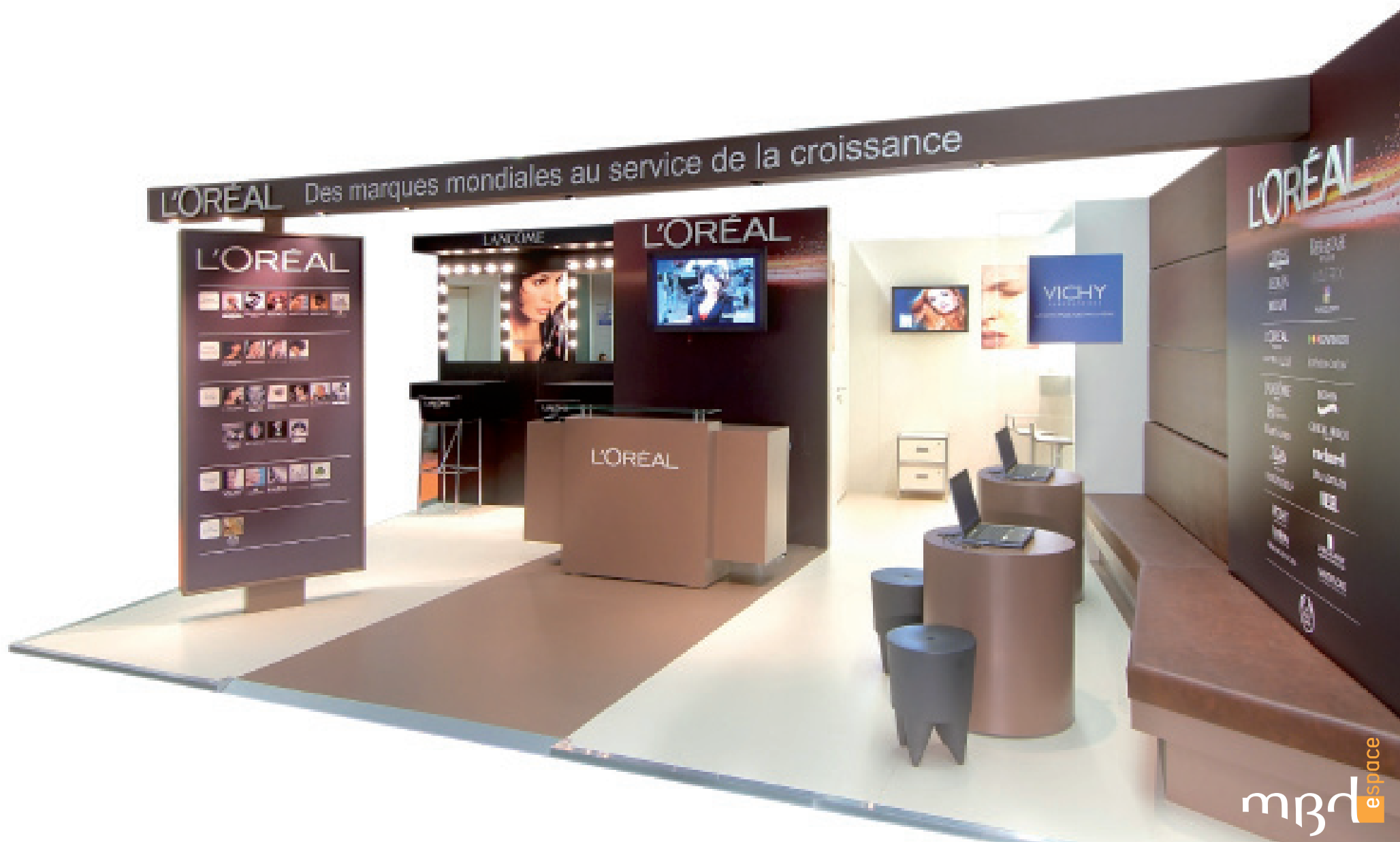
- Exposer : Stand d'exposition